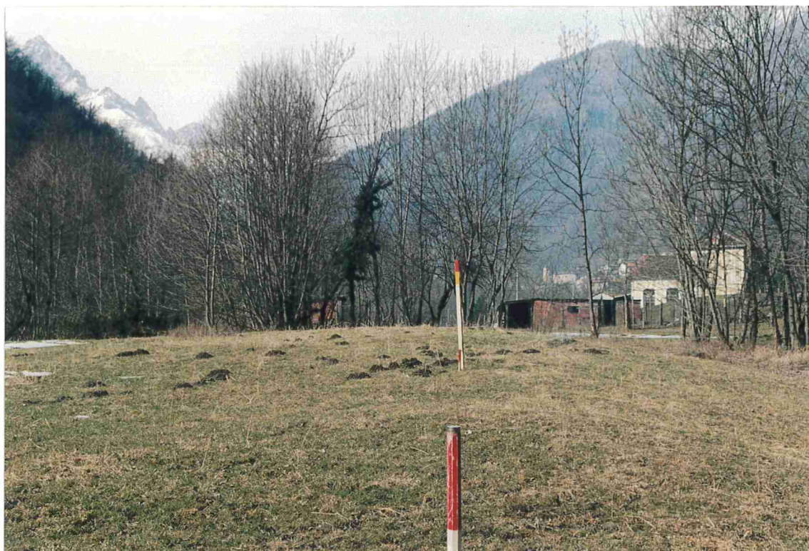
Traliccio n° 5.

Vista da valle verso monte sull'asse della linea aerea.