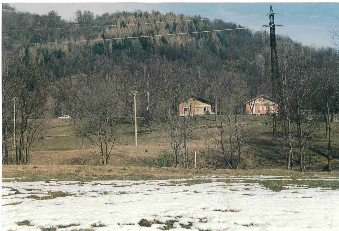
Traliccio n° 5.

Vista da valle verso monte sull'asse della linea aerea.